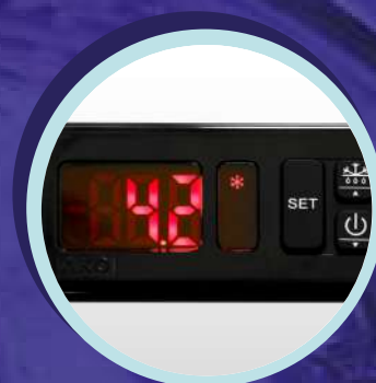
Control electrónico de temperatura