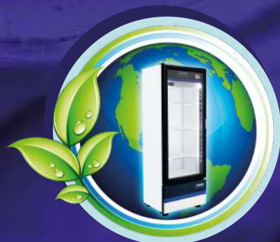
Bajo consumo de energía

Ahorra energía y protege al medio ambiente con refrigerante R-290