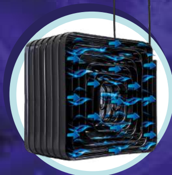
Condensador de bajo mantenimiento